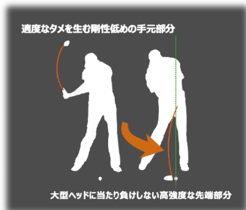
【新 Royal EZONE カーボンシャフト】

手元側のしなりがダウンスイング時のタメを促し、シニアゴルファーにとって振りやすい、効率良く飛ばせるシャフトを採用。