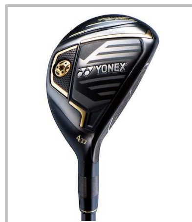
Royal EZONE ユーティリティ [新溝ルール適合モデル]