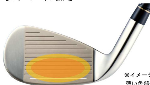
【スイートエリア拡大】