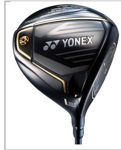
Royal EZONE ドライバー