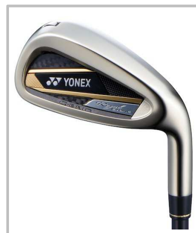
Royal EZONE アイアン [新溝ルール適合モデル]