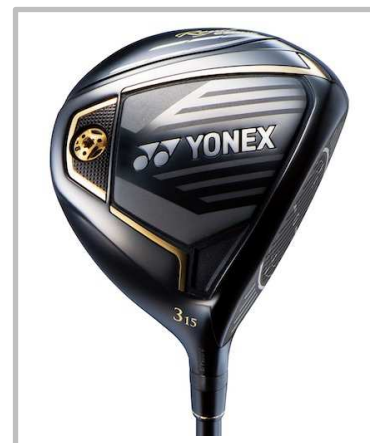
Royal EZONE フェアウェイウッド [新溝ルール適合モデル]